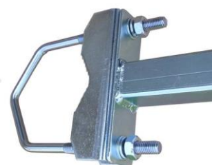
detail príruby + Z5V105